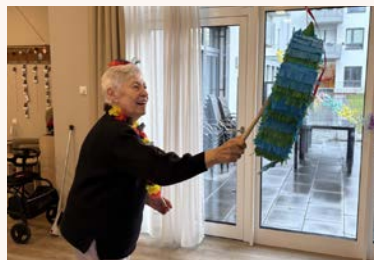
Die KG Königreich Duisern zu Gast im Seniorenzentrum Ernst Ermert

Besonderer Spaß in der AWOCura-Tagespflege im Marie-Juchacz-Haus: Eine Piñata sorgte für sportlichen Einsatz